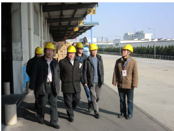
秦总经理（左三）来到作业现场视察

共存的伙伴关系；二是尽可能地集约资源，在硬件上下功夫，打造标准化、专业化的物流基地，筑巢引凤。他认为全方正是第一种模式活生生的案例，并深信，假以时日，必大有可为。