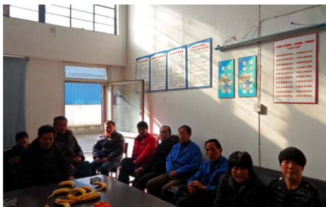
歇浦路仓库的“班前会”

文明班组、《调整、挖潜》“创新创效项目”参与奖、安全工作先进班组等奖项一一展现在班组成员面前，并宣读了2012年创建文明班组的规划，希望班组成员能继续保持荣誉。