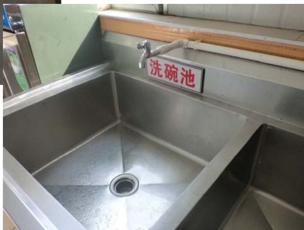
改造一新的全方公司就餐环境

了改造和修缮。此次工程严格按照国家相关标准，主要包括重新布局辟出消毒间和粗加工区，煤气管道检修，餐桌桌面翻新，电线线路改