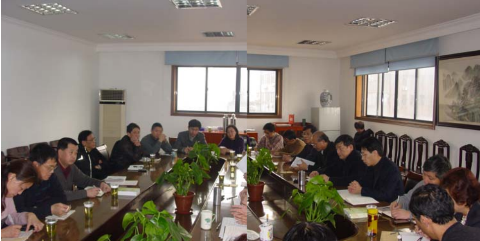
商储公司召开二〇一二年度工会工作会议

会上，各分（子）公司工会进行了工会工作交流。还就外来务工人员在企业中的地位问题展开了热烈地讨论。大家一致表示，要主动关心外来务工人员的工作、生活、学习，为他们搭建施展才华的平台，使他们真正融入到企业经营发展中来，为企业发展共同努力。大家还就企业近期稳定工作进行了讨论。